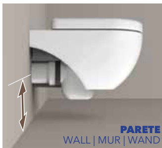
SCARICO PREESISTENTE EXISTING DRAINAGE SYSTEM ÉVACUATION AU SOL BESTEHENDES ENTWÄSSERUNGSSYSTEM

I vasi btw Plus sono gli unici adattabili all'impianto nato per un wc sospeso .