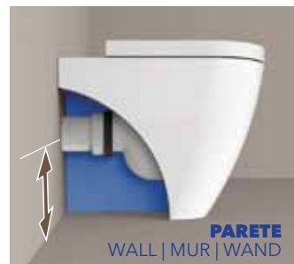
H 23 CM

WALL TRAP The WCs Plus only btw pans that can be installed where plumbing for a wall hung pan was foreseen.