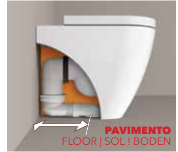
DA 22 A 33 CM FROM 22 TO 33 CM DE 22 À 33 CM VON 22 BIS 33 CM

FLOOR TRAP Combining different bends and connectors, the wcs Plus back to wall pans can be used for floor drainage installations between 5 and 33 cm (trap centre - wall).