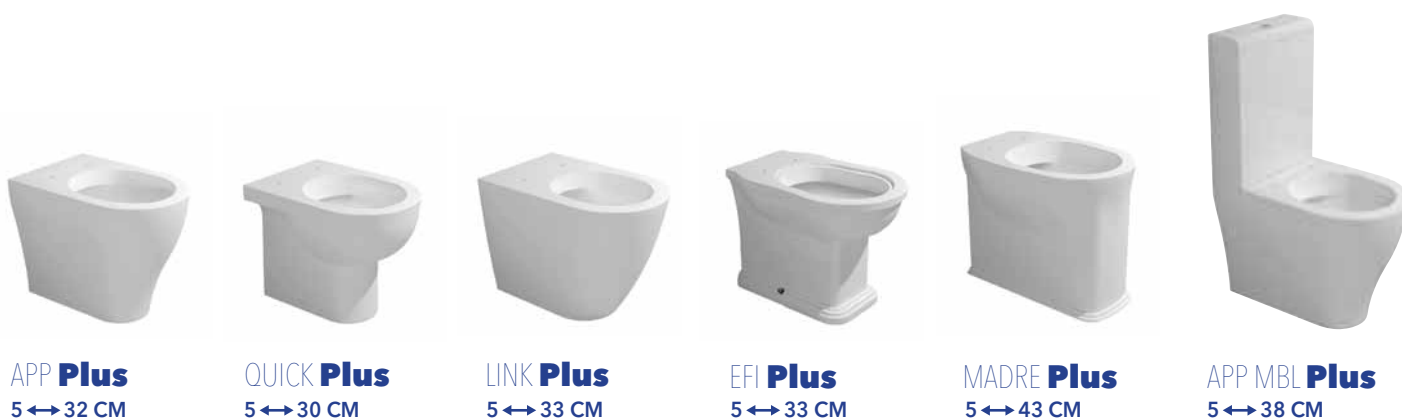
APP Plus 5 ↔ 32 CM