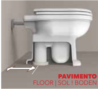
SCARICO PREESISTENTE EXISTING DRAINAGE SYSTEM ÉVACUATION AU MUR BESTEHENDES ENTWÄSSERUNGSSYSTEM

Combinando apposite curve e raccordi è possibile utilizzare i vasi back to wall Plus su predisposizioni di scarico a pavimento comprese tra i 5 cm e i 33 cm (centro scarico - parete).