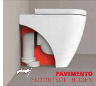
DA 5 A 12 CM FROM 5 TO 12 CM DE 5 À 12 CM VON 5 BIS 12 CM